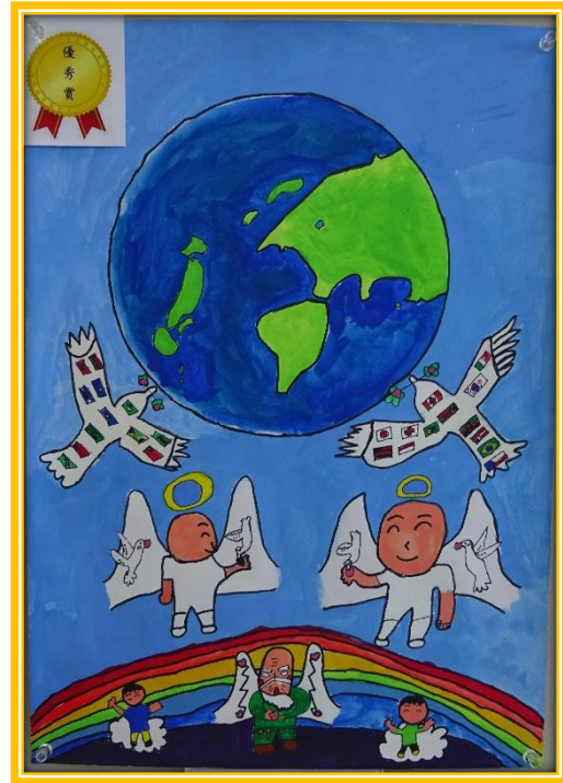
優秀賞 田中 颯流